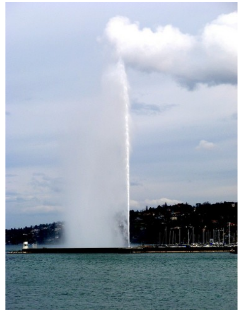
Fontäne am Genfer See

Nach dieser Schulstunde stiegen wir in unseren Bus ein, um Genf und die dortigen Einrichtungen der UNO zu besichtigen. Das war eine etwas längere Fahrt von einer Stunde, denn Genf liegt in der Schweiz, an der Grenze zu Frankreich. Dort schauten wir uns auch noch einige andere Sehenswürdigkeiten an, wie zum Beispiel das Denkmal von Henri Dunant, des Gründers des Roten Kreuzes, die Kathedrale Saint-Pierre und das Internationale Reformationsdenkmal, auf dem Statuen von Calvin, Knox und weiteren Reformatoren zu sehen sind und das die Geschichte des Protestantentums wiedergibt. Dazu wurde uns auch noch etwas über das Ideen und den geschichtlichen Hintergrund der Reformation erzählt. Nach dieser Führung hatten wir alle eine Stunde Zeit, um Genf alleine zu besichtigen und dort auch shoppen zu gehen.