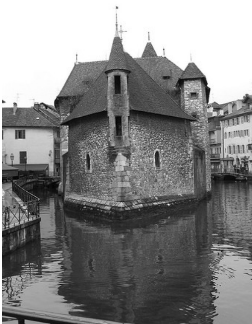
Altes Gefängnis von Annecy

Am Dienstag morgen traf sich die ganze Klasse um 8 Uhr in der Schule. In der 1. Stunde waren jeweils drei deutsche Schüler in jeweils einer französischen